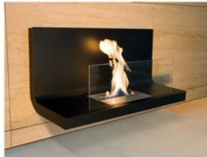
Cheminée à éthanol en 2009

réservées aux privilégiés... jusqu'à temps que ça dure ; Le futur me l'a démontré ! j'espère que le futur que j'ai vu soit le nôtre ( gloups... )