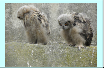
Due giovani gufi reali.

Quelli a sinistra siamo noi , invece quelli a destra sono i primi “amici” che abbiamo incontrato al Parc Ornithologique de La Camargue (parco ornitologico della Camargue), in Francia .